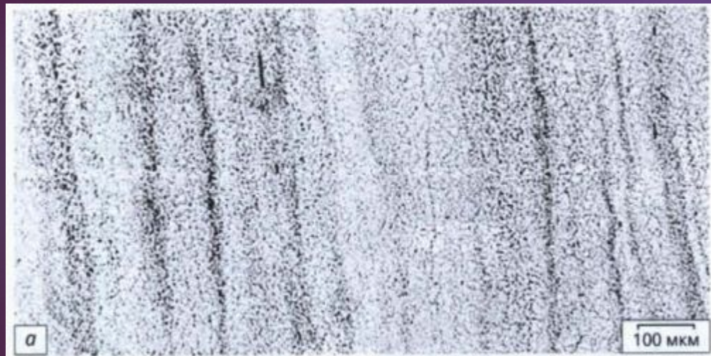
а - № 3 из стали 20ХН3А