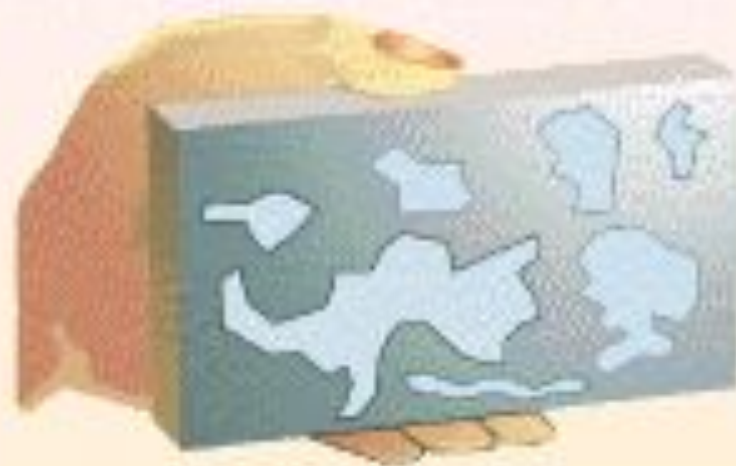
Деталь после окраски на плите