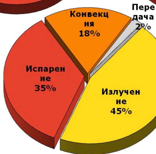
Теплообмен с лучистой системой охлаждения

Применение лучистой системы охлаждения – оптимально для теплообмена человека