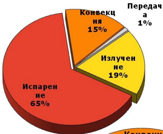
Теплообмен без системы охлаждения