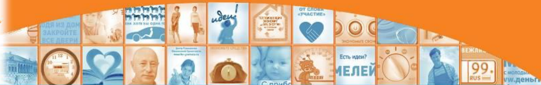
Доли респондентов видевших макет программы (%)