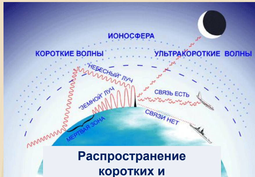
Распространение коротких и ультракоротких волн

Одним из первых выдвинул идею радиолокации Луны (1942).