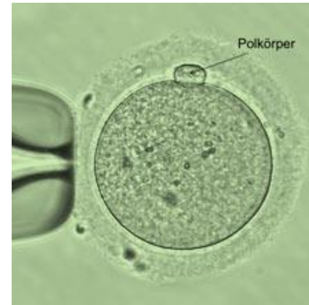
ЯЙЦЕКЛЕТКА С ПОЛЯРНЫМ ТЕЛЬЦЕМ