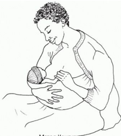
Метод Кенгуру Кормление грудью недоношенного ребенка