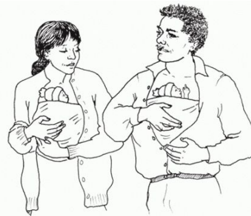
Метод Кенгуру Держим младенца близко к груди

а. Мать поддерживает свою грудь ладонью руки и тремя крайними пальцами.