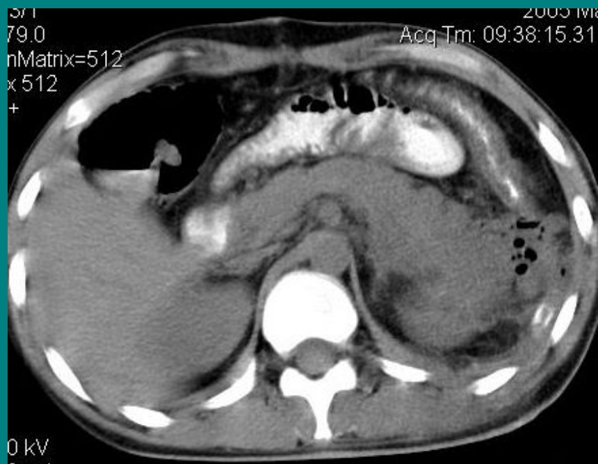
Состояние после операции. Забрюшинная флегмона