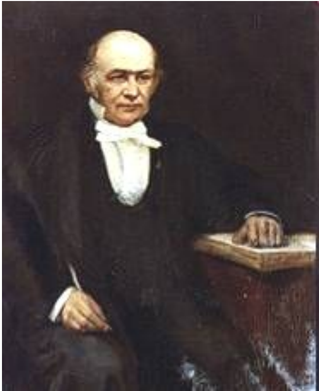
Уильям Роуэн Гамильтон (1805 -1865) — выдающийся ирландский математик и физик.