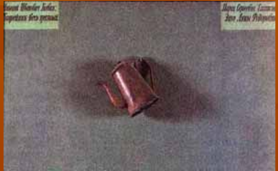
И. Кабаков Из цикла «Вопросы и ответы» 1976г.