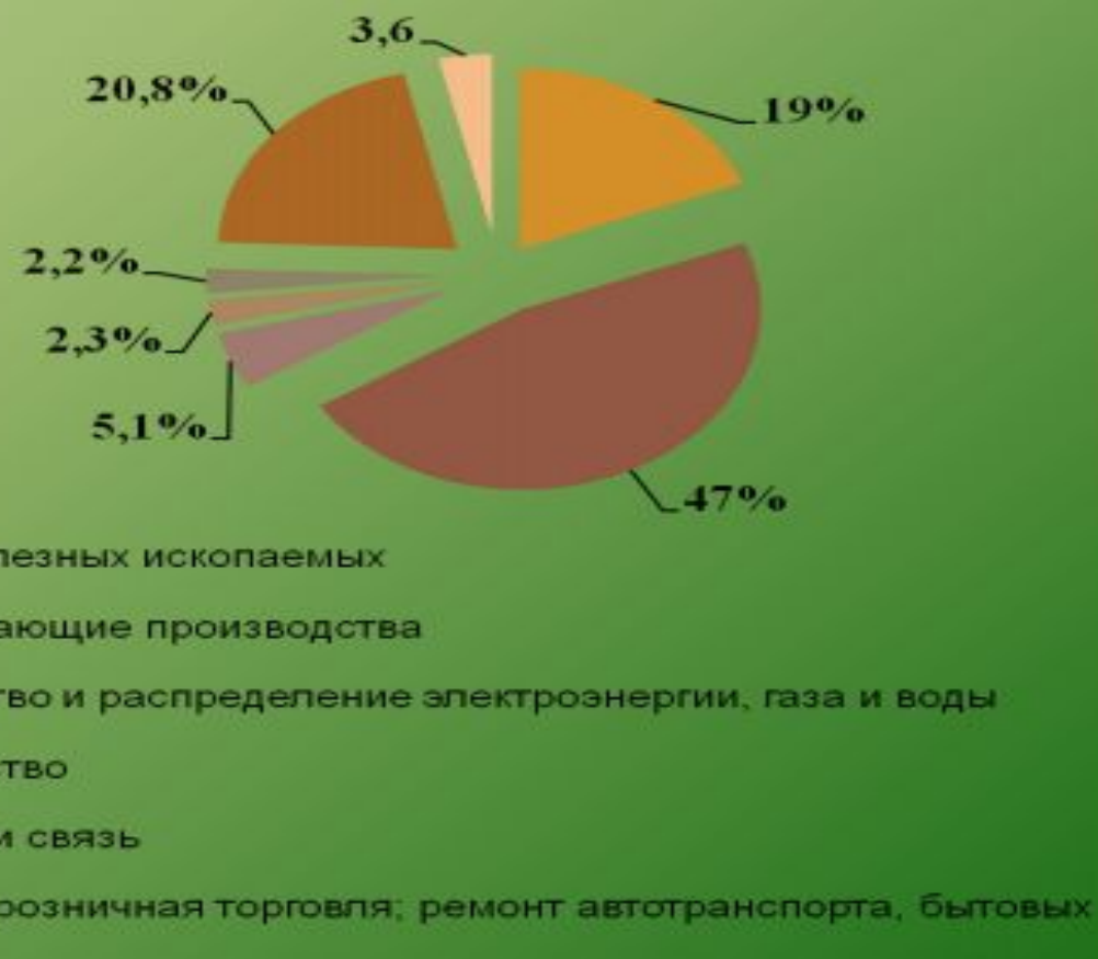
Структура малых организаций по видам экономической деятельности и их оборота в 2013 году, %