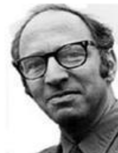
Томас Сэмюэл Кун

Парадигма - научная теория, которой придерживается большинство ученых.