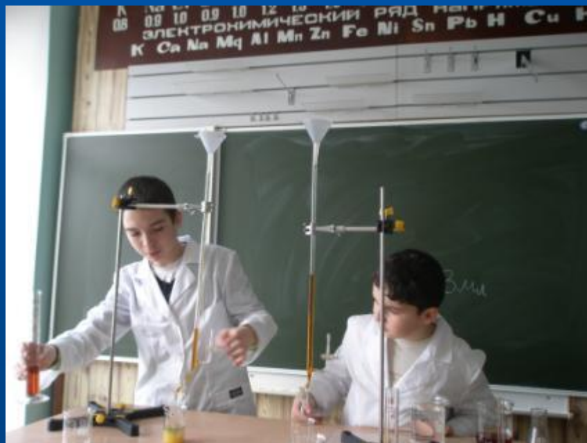
Фото 6: Титрование пробы сока 5% спиртовым раствором йода