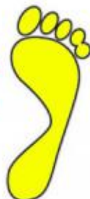
I степень плоскостопия