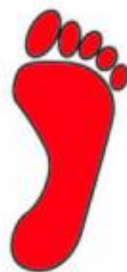
II степень плоскостопия