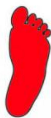
III степень плоскостопия